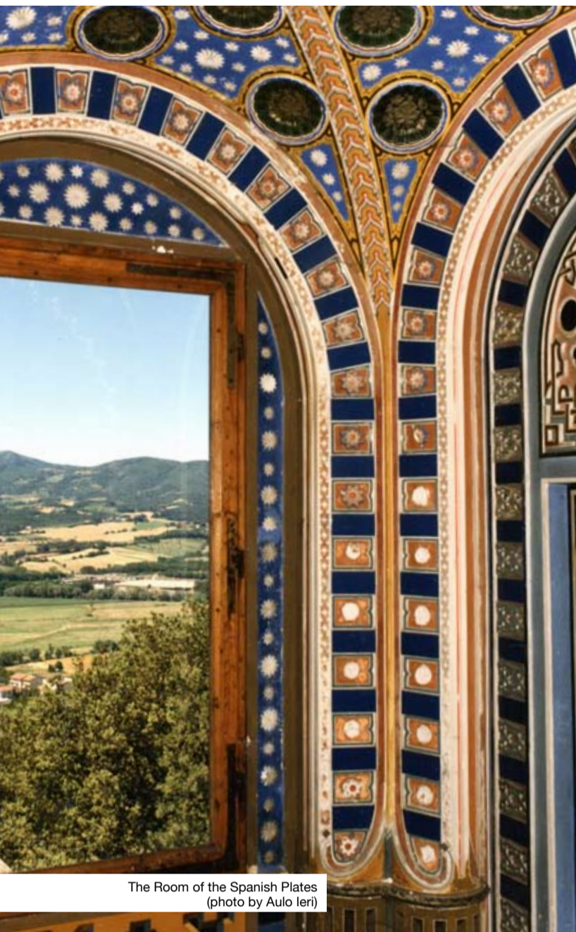
The Room of the Spanish Plates